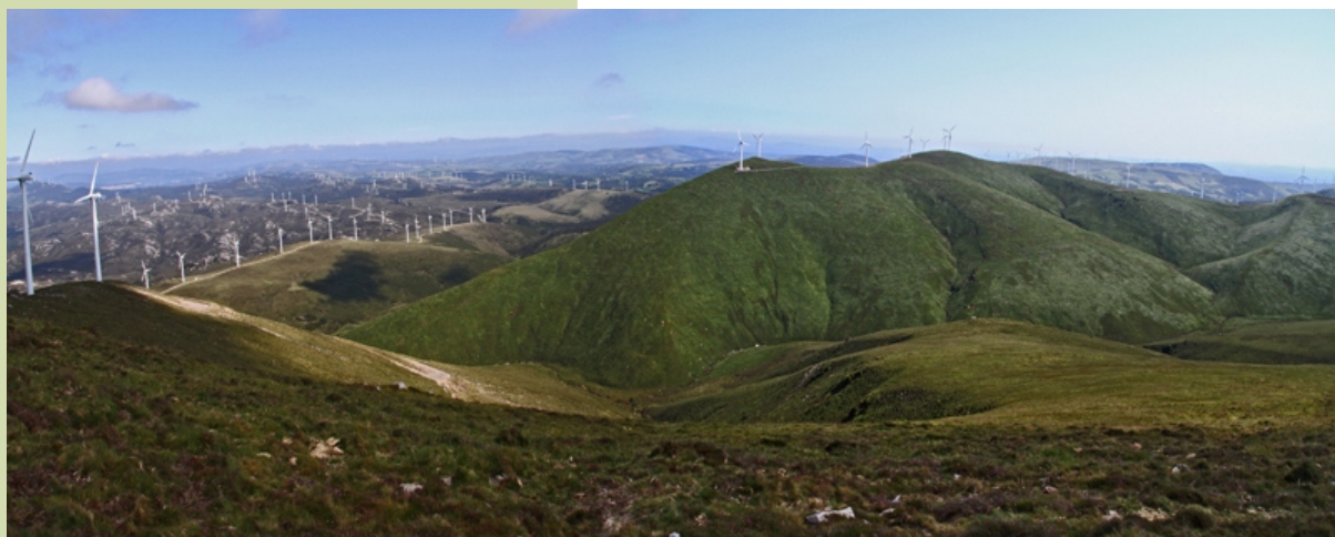
Vista dos cumes Fraga do Pedrido e Lombo Pequeno e as nacentes do río do Pedrido (Masma) desde o Cadramón.