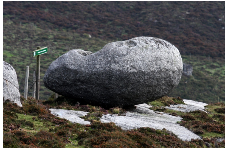
Pena abaladoira. Ao pé da subida ao Cadramón, indicador de madeira á beira da estrada sinada a dirección da ruta. Para chegar a ela séguese preto da aramada uns 300 m.