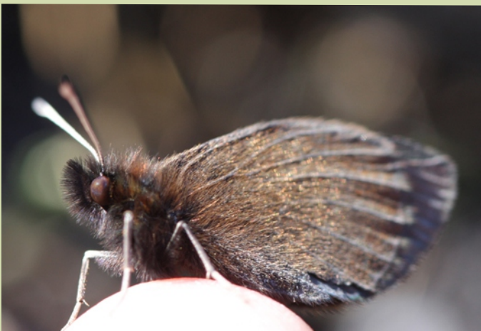
Erebia epiphron , unha bolboreta endémica do Xistral.