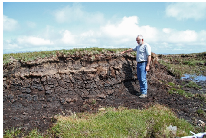
Detalle de turba. Nalgúns puntos do Xistral a turba acadou os 3 m de espesor, co que considerando a súa velocidade de formación, lle dá unha antigüidade de máis de 7.000 anos.