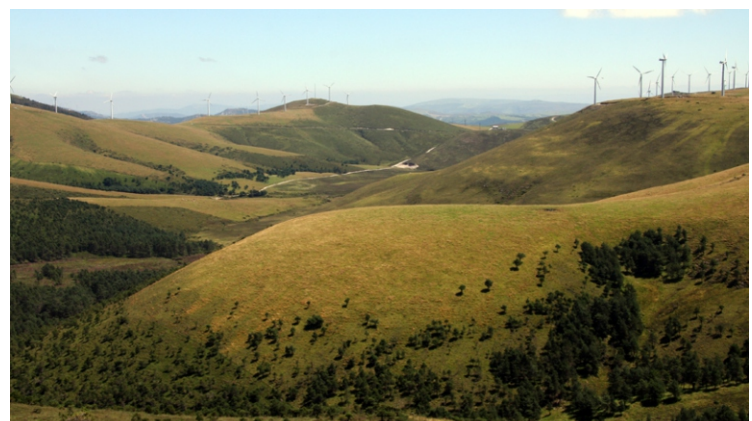
Vista das nacentes do Eume desde o cume do Xistral.