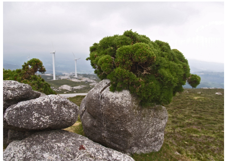
O alto nivel de humidade permite a pervivencia de especies arbustivas enriba das pedras.