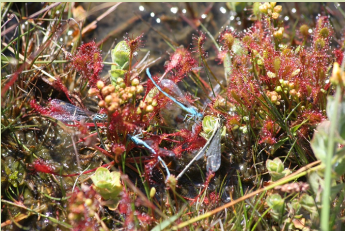
Rorela ( Drosera rotundifolia ) coas súas capturas. A rorela é unha planta carnívora típica de espazos asolagados pobres en nutrientes.

Desde Ferreira do Valadouro collendo a estrada local a Recaré, Frexulfe e O Cadramón, ao pouco de saír de Frexulfe atópase a ferverza do rego das Cancelas e preto de san Xurxo as do rego de Corvelle e o Escouridal. Pasado San Xurxo do Cadramón, no Campo, temos a subida ao repetidor de televisión da Pena da Cadela (6 km) un punto desde onde podemos ver amplas panorámicas da serra. Un pouco máis adiante atopamos a estrada que sube (5 km), polo parque eólico, ao Pico do Cadramón , o cume máis alto da serra. Uns quilómetros máis adiante atopamos o tremoal da Pena Vella (Abadín), onde podemos facer unha parada para observar as vistas e a flora e fauna típica das turbeiras. Seguimos ata un cruce e collemos pola dereita cara a Montouto; na entrada da Vacariza sae á dereita unha pista de terra que en tres quilómetros nos pon nas turbeiras do nacemento do Eume . Continuamos pola estrada á Balsa e desde alí a Viveiró. Antes de chegar a Viveiró, en Porromeu, unha pista de 5 km lévanos ao cume do Xistral . Seguimos a Miñotos onde podemos ver as fragas das cabeceiras do río Landro (regos de Besteburiz e As Balsadas), e logo continuamos pola estrada que vai ás Lobeiras onde collemos cara á dereita en dirección a Ferreira. Un pouco adiante do cruce, nas Lobeiras, hai unha pista que sube ao curro de Candaoso e os montes do Buio (2,2 km). Volvemos á estrada e rematamos a viaxe de novo en Ferreira.