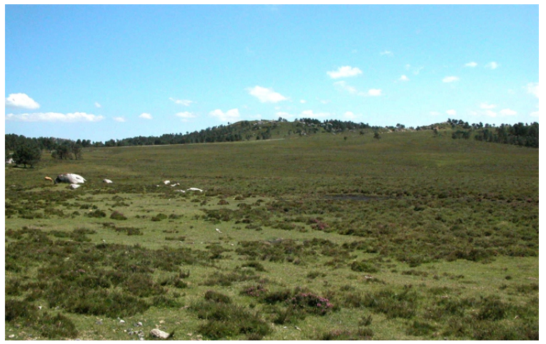
Tremoal da Pena Vella en Abadín. Os tremois son turbeiras en zonas chans.